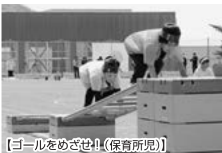
【ゴールをめざせ!(保育所児)】