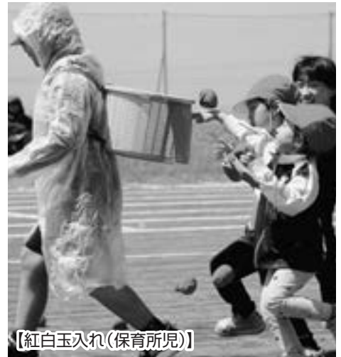
【紅白玉入れ(保育所児)】

全員が協力し合い、努力して練習した成果を全力で発揮する、子どもたちだけでなく観客の皆さんも一つになった、まさにスローガンのとおりの充実した一日となりました。