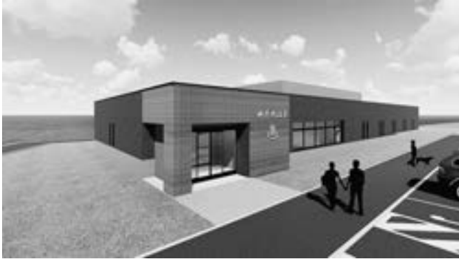
▲ 正面イメージ(注：神恵内温泉は仮称です)

村民をはじめ、来訪者の皆さんに愛され、親しんでいただける新温泉になるよう、広く名称を募集します。