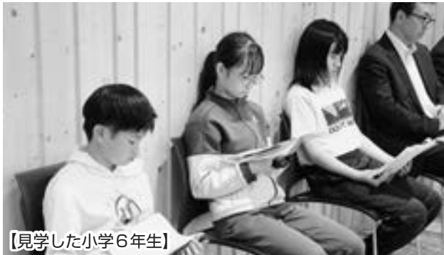
【見学した小学6年生】

児童たちは見学した感想を「お話が難しかった」、「迫力がすごかった」と話していました。