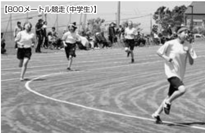
【800メートル競走(中学生)】