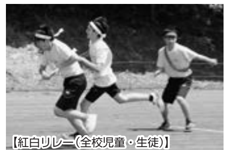
【紅白リレー(全校児童・生徒)】