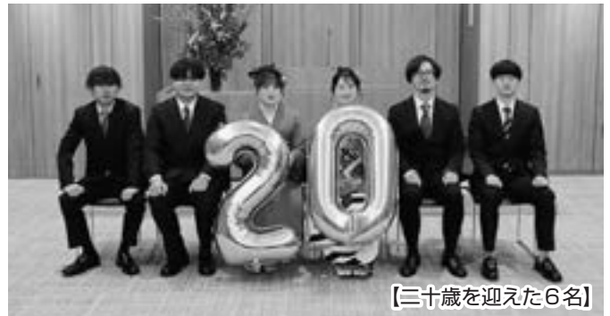
【二十歳を迎えた6名】