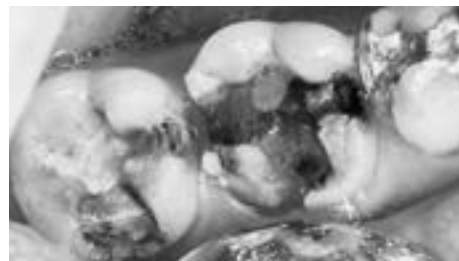
むし歯が再発している