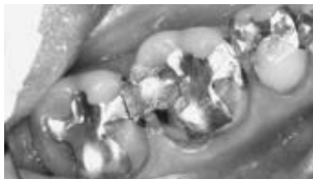
歯の詰め物を外すと...

むし歯治療では歯を削るため、再発リスクが高くなります。詰め物やかぶせ物の隙間に汚れが溜まりやすくなるのが、むし歯や歯周病を引き起こす原因の一つです。