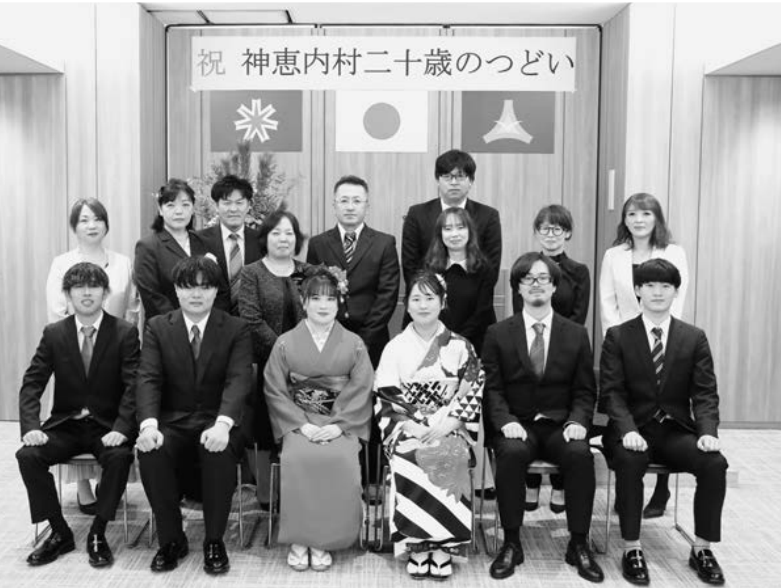
神恵内村二十歳の集い（1月11日）